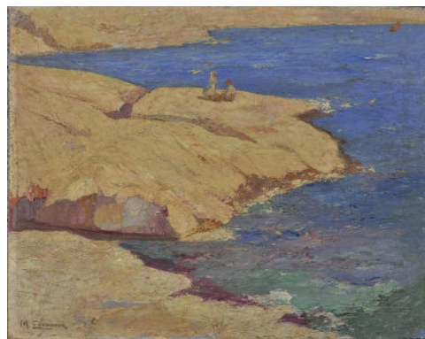
Μιχάλης Οικονόμου, Θαλασσινό τοπίο (1920 – 1926)

Εργασία για το σπίτι: Επιλέξτε από τη λίστα τραγουδιών που σας δίνεται παρακάτω και από τους πίνακες ζωγραφικής (είτε αυτούς που είδαμε στο μάθημα είτε και εικόνες δικές σας που συνδέονται νοηματικά με το ποίημα) και συνθέστε μία ψηφιακή αφήγηση , όπου θα απαγγέλλετε εκφραστικά το ποίημα της επιλογής