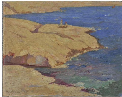
Μιχάλης Οικονόμου, Θαλασσινό τοπίο (1920 – 1926)

Σημείωση: Για τον σχολιασμό των πινάκων ζωγραφικής καλό θα είναι να έχει προηγηθεί συζήτηση όπου, μέσω ερωτήσεων που θέτει ο/η εκπαιδευτικός, οι μαθητές/τριες θα έχουν εξοικειωθεί α) στο να παρατηρούν έργα τέχνης (Τι βλέπετε / Τι παρατηρείτε στον πίνακα;), Τι νομίζετε ότι συμβαίνει στον πίνακα; (ενεργοποίηση σκέψης), Υπάρχουν απορίες που σας γεννώνται βλέποντας το έργο; Τι περισσότερο θα θέλατε να μάθετε; (εμβάθυνση).].