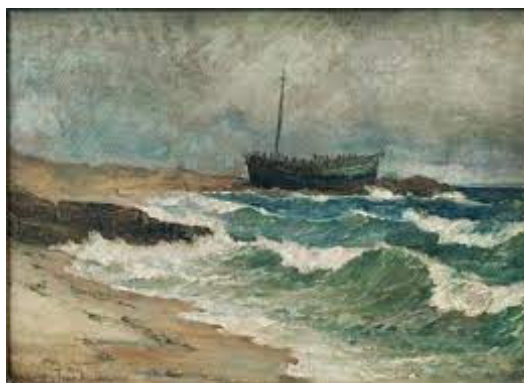
Ιωάννης Αλταμούρας, Θαλασσογραφία (1874)